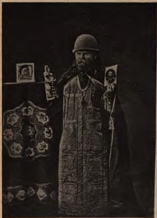
Епископъ Геннадій, освобожденный императоромъ Александромъ III.